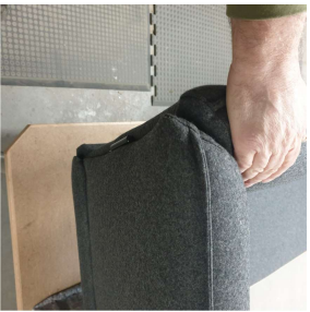
Gehrung oben austreifen